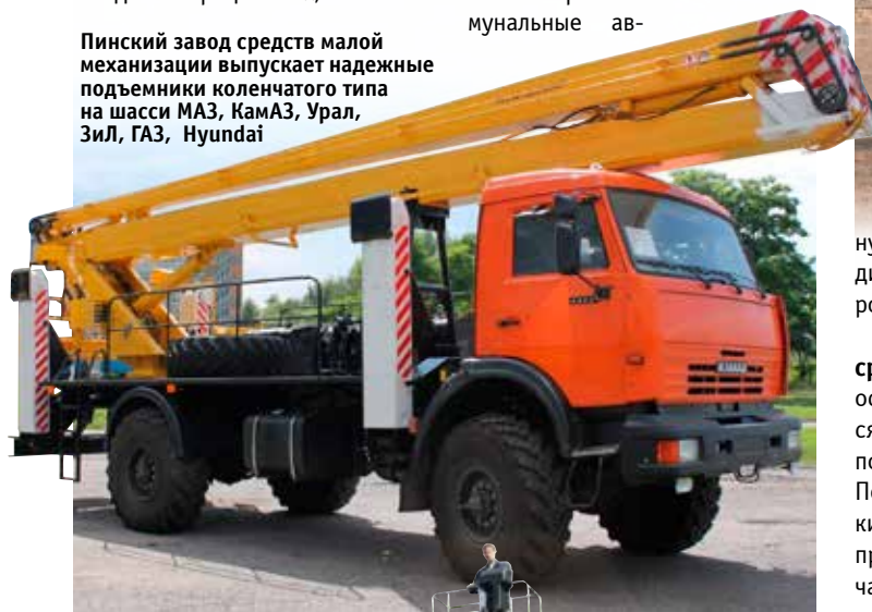
Пинский завод средств малой механизации выпускает надежные подъемники коленчатого типа на шасси МАЗ, КамАЗ, Урал, Зил, ГАЗ, Hyundai

лее десятка базовых моделей АГП и множество их модификаций. На заводе освоено выпуск коленчатых подъемников, телескопических и комбинированных, с максимальной рабочей высотой от 15 до 50 м. Стрелы для АГП изготавливаются непосредственно на «Пожтехнике» из листовой легированной стали, поэтому стрела получается прочной и достаточно легкой. На строительные и коммунальные ав-