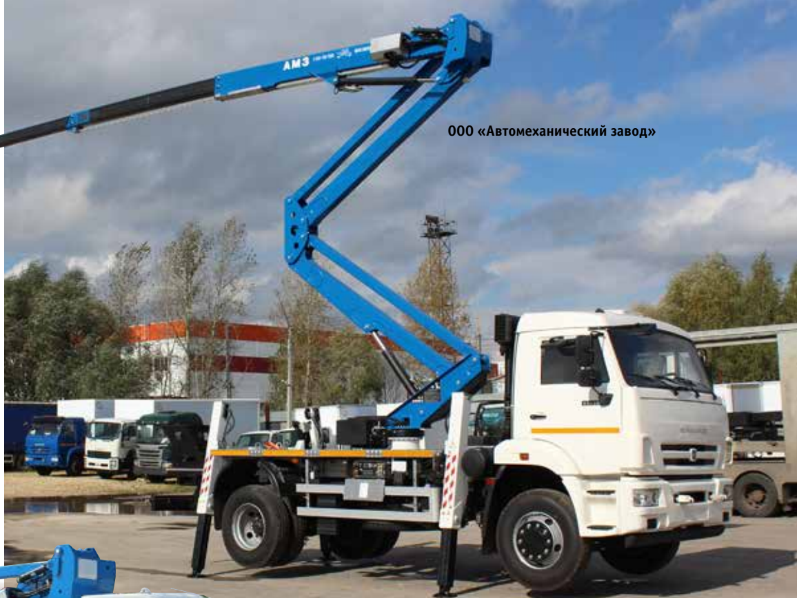
000 «Автомеханический завод»