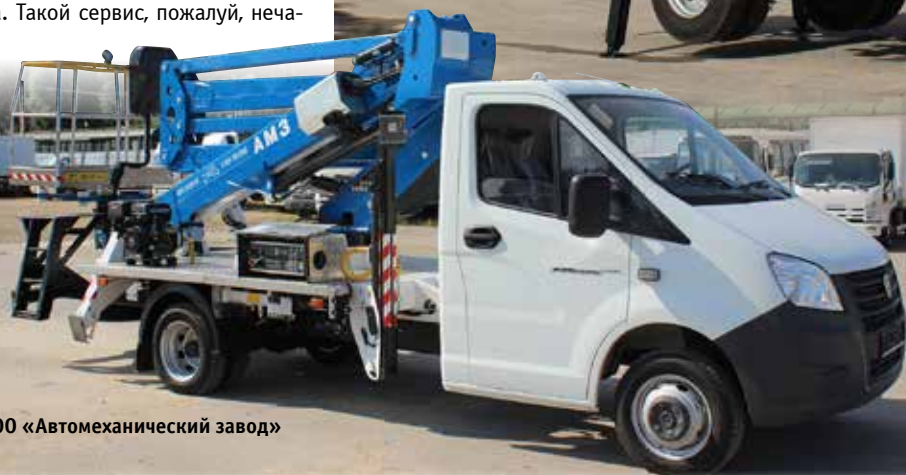
000 «Автомеханический завод»

сто встретишь среди российских компаний. При этом гарантийный период на гидравлические подъемные установки составляет 24 месяца, что уже говорит об их высоком качестве.