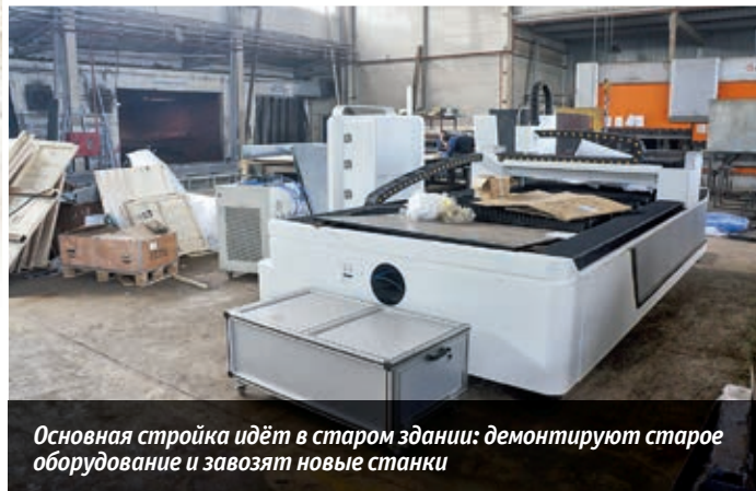
Основная стройка идёт в старом здании: демонтируют старое оборудование и завозят новые станки

Разумеется, активное перевооружение немислимо без нового оборудования: теперь на AM3 есть своя установка для создания двухкомпонентного клея, в два раза увеличена производительность участка склейки (3 из 4-х старых столов заменены на новые, и дополнительно установлено ещё 4, суммарно 8 сто-