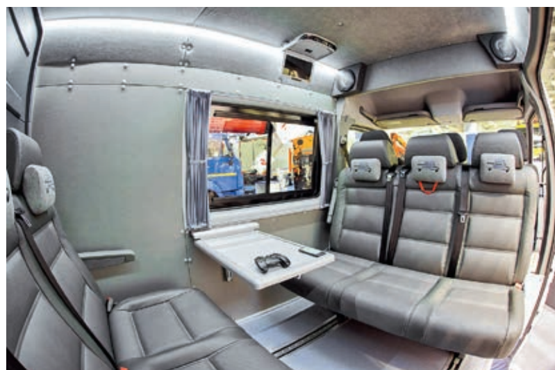
Не обошёлся АМЗ и без популярного в настоящее время ЦМФ Mercedes-Benz Sprinter Classic