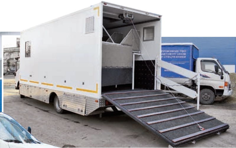
Коневозка АМЗ-47056J на шасси Isuzu Elf, рассчитанная на перевозку пяти лошадей

является посредством электрической лебёдки.