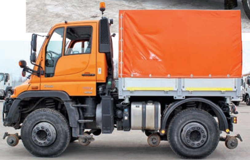
На данной машине от АМЗ только надстройка, а шасси Mercedes-Benz Unimog U400 «бэушное»

С4 грузоподъёмностью до 1000 кг. К слову, на нём же крепится стальной держатель запасного колеса.