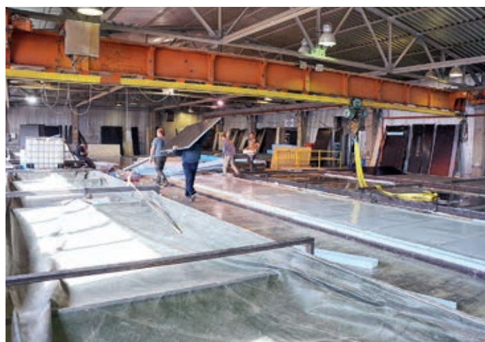
После модернизации на втором этаже вместо одного стапеля для боковин фургонов появилось четыре

« Панорама нового цеха. Основная продукция – изотермические и промтоварные фургоны