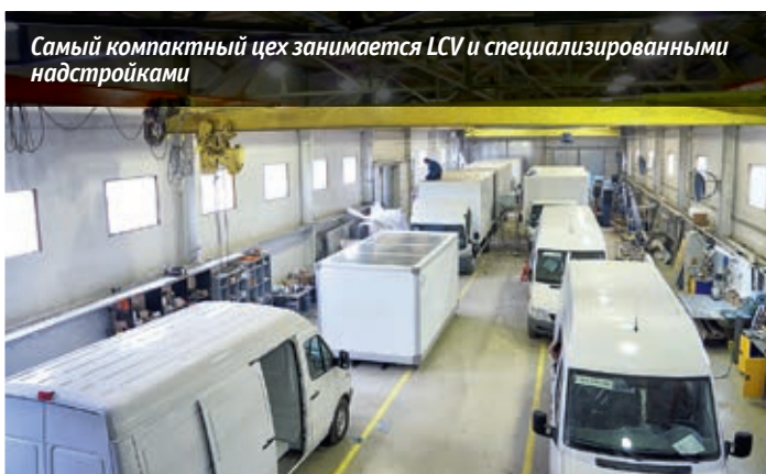
Самый компактный цех занимается LCV и специализированными надстройками

а пока я был на экскурсии, из цеха выкатился тентованный Mercedes-Benz Atego 1222 и тоже направился к воротам. В самих цехах было не менее десятка единиц техники на различных стадиях сборки: эвакуаторы для Санкт-Петербурга на шасси JAC N75, фургоны на шасси Isuzu,