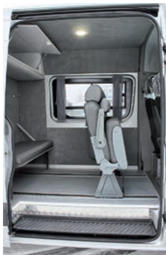
А это уже салон немецкого Sprinter, в рассчитанном на «дальнюю» салоне нашлось место и для спальной полки

Другой интересный медицинский проект – мобильный комплекс на шасси «ГАЗон NEXT» С42R33 CITY «Фермер» с колёсной базой 4515 мм и двухрядной кабиной. Фургон дли-